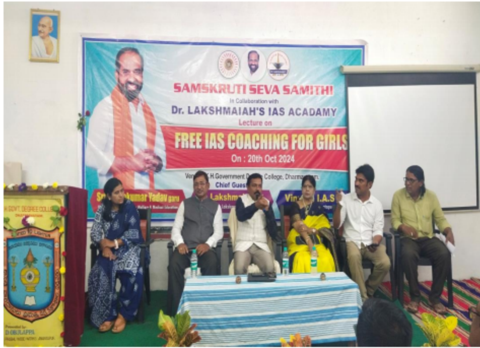
Felicitation pictures of the Ceremony